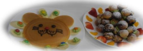
らいおんさんケーキ・たこ焼きツリーケーキ