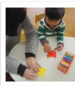
折り紙で鬼の制作

3月は卒園式や進級に向け何かと行事も多く、子育て支援室がお休みだったり担当職員が不在だったりご迷惑をおかけしますが遠慮なく遊びに来てください。お待ちしております。 園舎の周りにはきれいな花がたくさん咲き、お散歩も楽しめそうですよ。