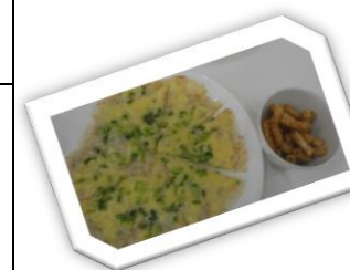
お米のピザとかりんとう