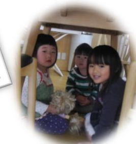
机の下も楽しい遊び場