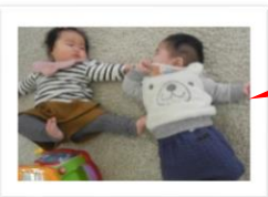
初めてのおともだち