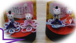
今年のおひなさま